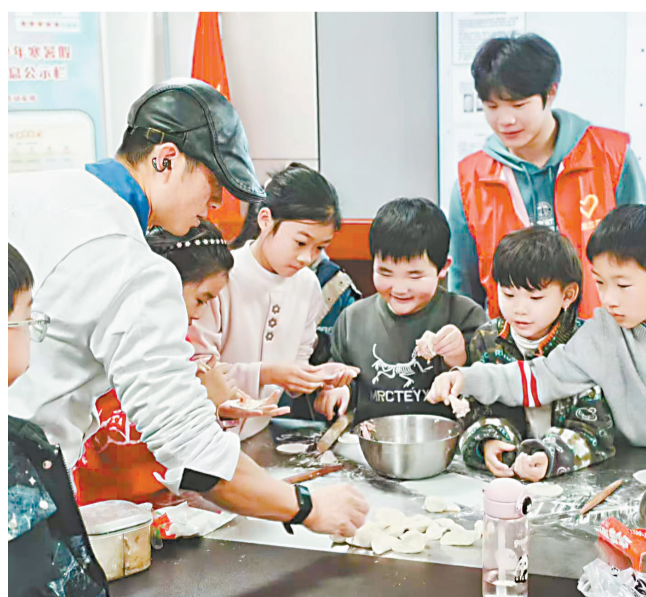
在中西面点体验区,同学们动手学习包饺子。

验中心是武汉市首批十七所中小學生职业体验中心之一,依托学校烹饪专业优势,配备了标准化实训厨房、中西面点实训室与营养配餐教室,累计已接待两千余名中小學生开展职业体验活动。未来,学校还将推出“非遗淮菜制作”“家庭烘焙工坊”等特色体验项目,让更多青少年在烟火气中感受职业教育的魅力,感受以劳动树德、以劳增智、以劳健体、以劳育美、以劳赋能的职业初体验活动,为未来职业规划种下梦想的种子。