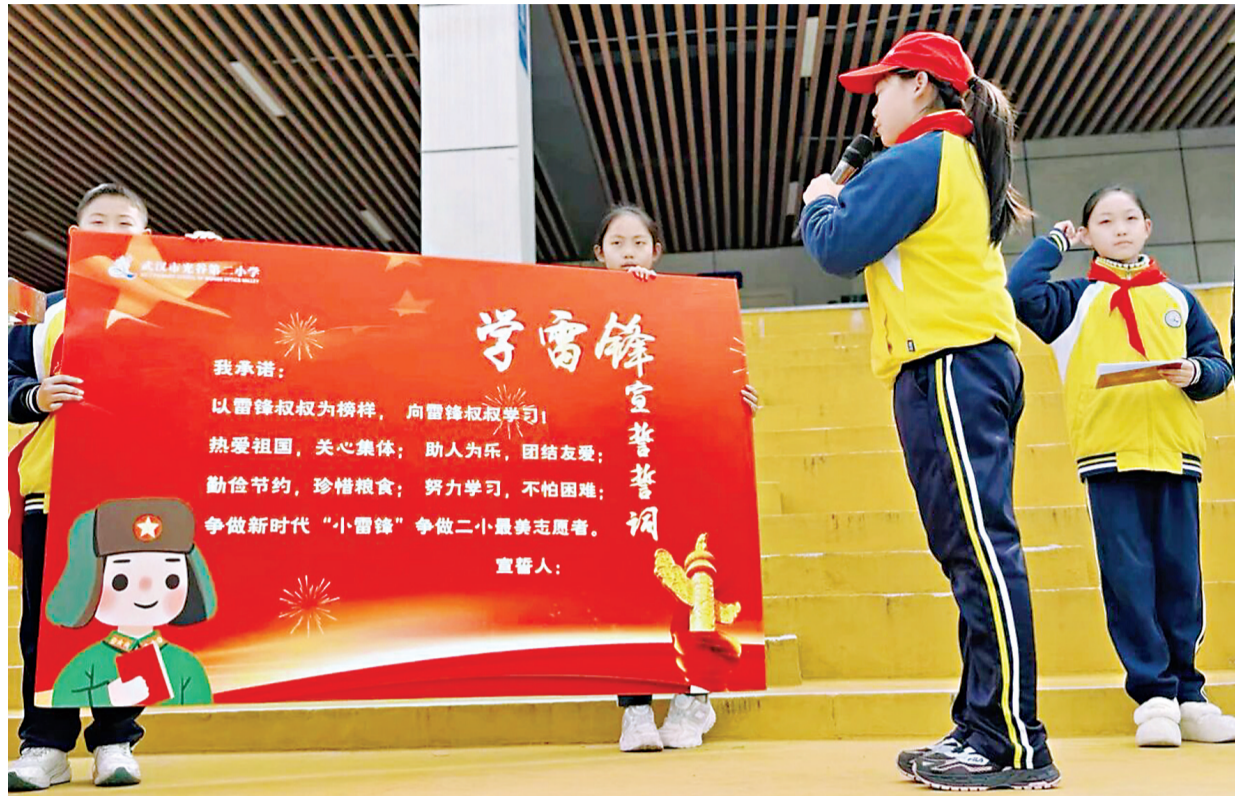
光谷二小义工节启动。

羞涩的孩子在舞台上发出了第一声响亮的自我介绍,专注的身影在机器人前认真调试了整整一个下午,灵巧的小手绣出了人生第一幅姓氏刺绣,热情的红马甲在晨光中迎来第一位到校的同学……三月的武汉市光谷第二小学校园里,处处可见孩子们成长的惊喜瞬间。