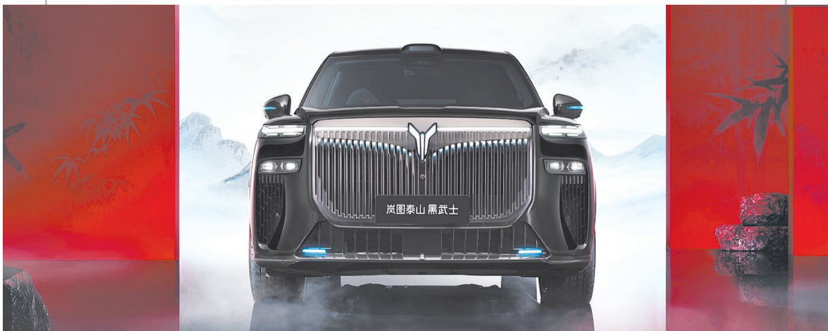
3月17日，岚图泰山黑武士版上市。