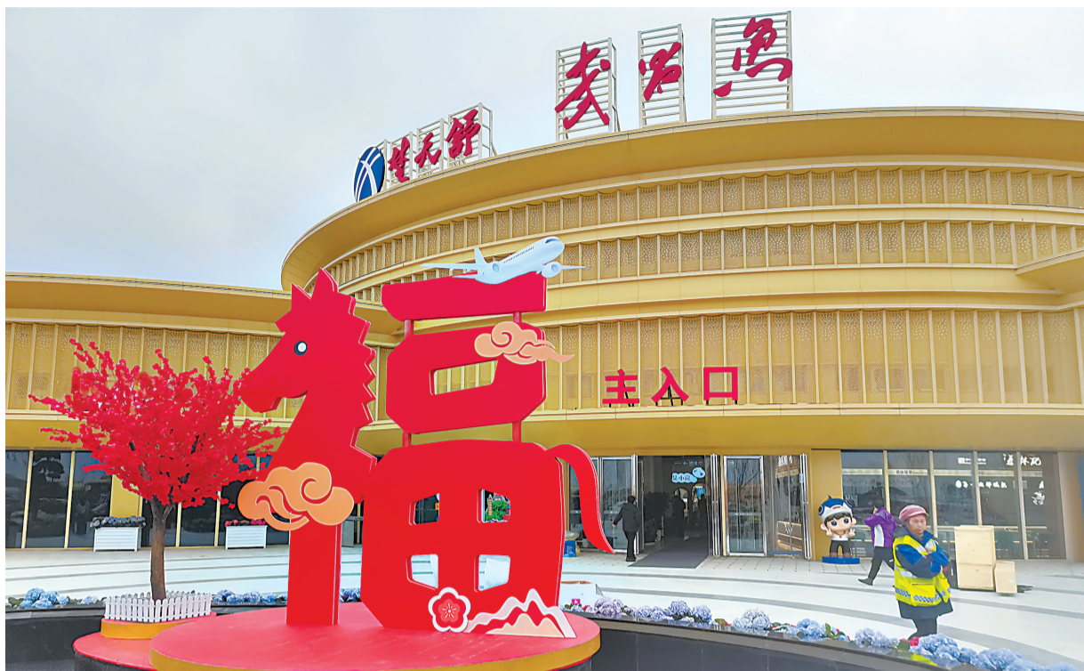
武昌鱼服务区南区广场上,巨大的红色“福”字静候八方来客。

随岳高速石家河互通工程位于天门市石家河镇,通车后可直连G240国道,快速衔接石家河、佛子山等周边乡镇及天门城区。从随岳高速石家河收费站下高速仅10分钟即可抵达石家河遗址博物馆,为地方文化遗产保护与文旅融合提供了便捷通道。