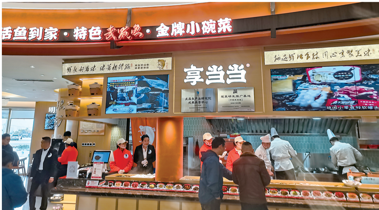
武昌鱼服务区的武昌鱼主题餐厅。