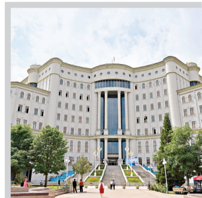
2025年5月29日在塔吉克斯坦首都杜尚别拍摄的塔吉克斯坦国家图书馆。