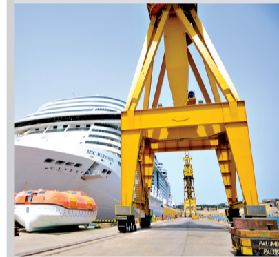
2022年4月22日,在马尔代夫瓦莱塔,一艘大型邮轮在6号干船坞进行维修。