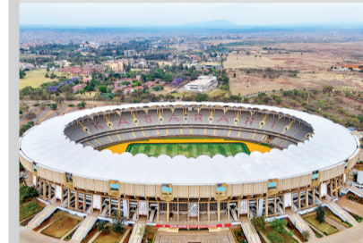
2025年9月24日在肯尼亚首都内罗毕拍摄的莫伊国际体育中心(无人机照片)。