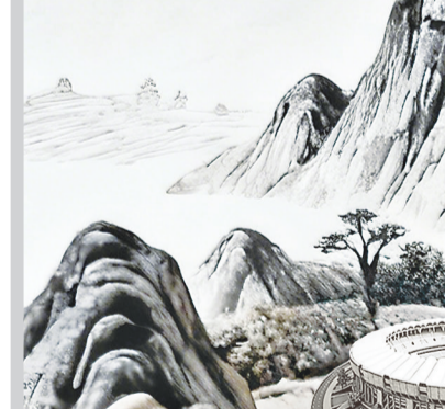
2023年10月,摩洛哥最新一期高铁列车在摩洛哥境内行驶。