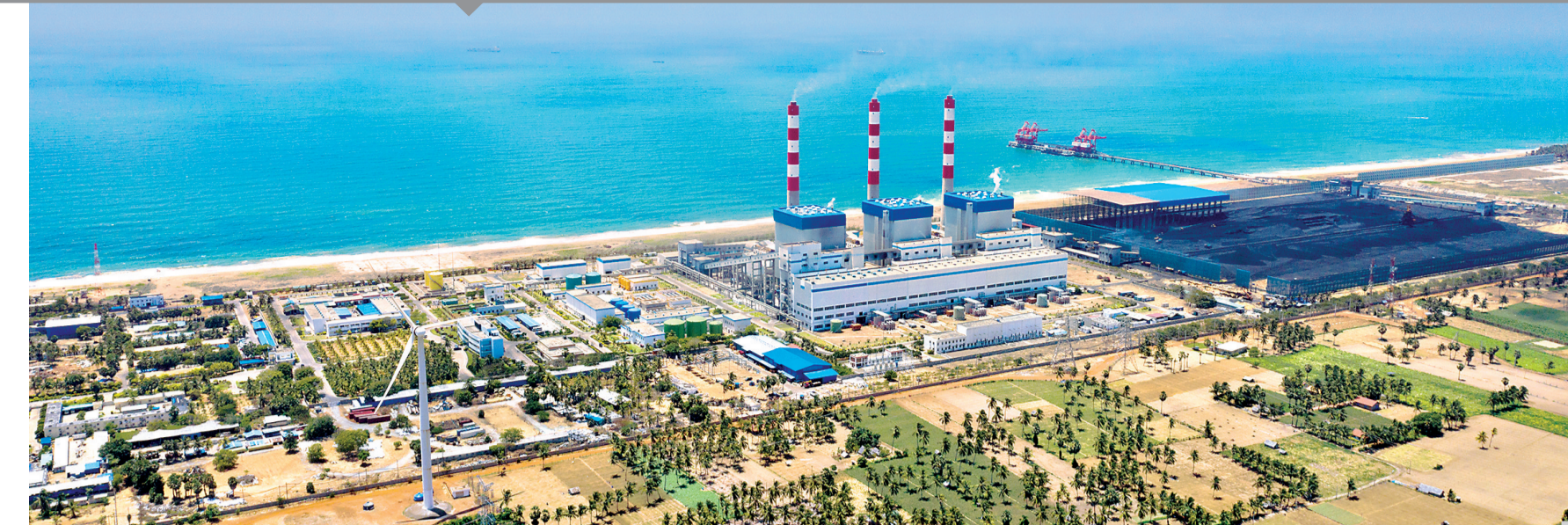
2025年1月10日在斯里兰卡卡尔皮提亚拍摄的普特拉姆燃煤电站。

一国钱币上的图案,常常展现一个国家的历史文化特色和社会发展成就。如今,一些中国印记出现在世界不少国家的钱币上,流通于当地民众的日常生活中——从大桥到高楼,从水稻到水电站,或是“小而美”的民生项目,每一个都见证着中外合作的动人篇章。 这些外币上的中国印记,讲述着中国与世界各国人民之间的深厚情谊,展现出中国与世界携手前行、共同发展的动人交响。