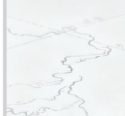
2022年4月22日,在老挝万荣水泥厂,一座大型工业建筑正在建设中。