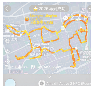
上海网友设计的线路图。

除了上海,北京、广州、深圳、合肥、杭州等多个城市,也陆续涌现出各式各样的“画马线”。这些路线风格各异,有的穿梭于繁华都市的街巷里弄,以“城市漫步”的悠然节奏完成;有的则隐匿于郊野森林公园之中,让爱好者在亲近自然的过程中,解锁别样的“画马”体验。