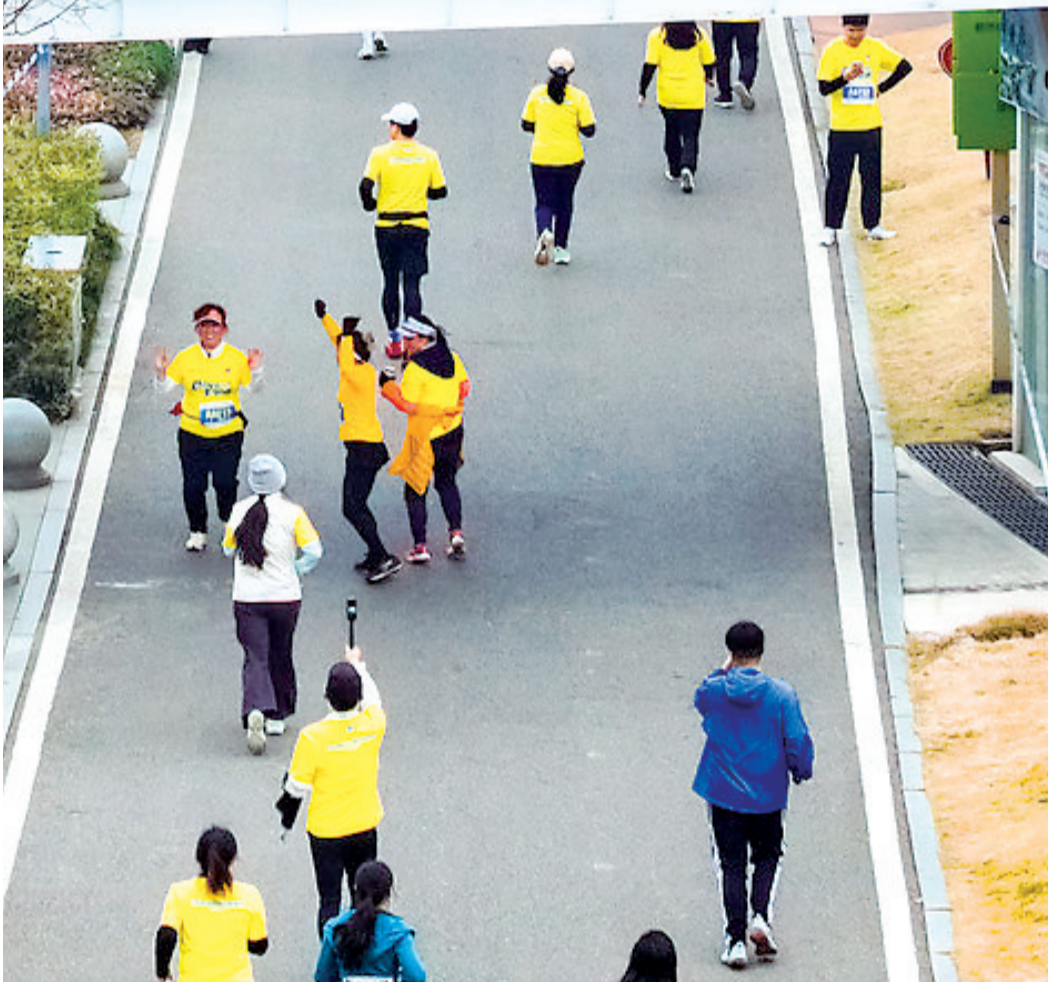
跑友在青山江滩畅跑。