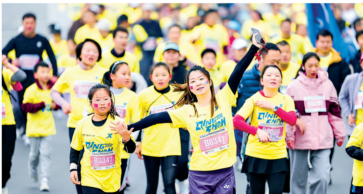
1月18日上午,汉马系列赛·2026武汉青山迎春跑鸣枪开跑。