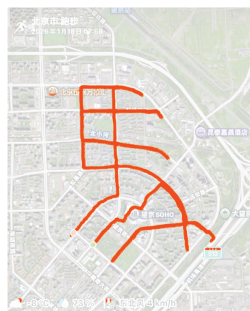
北京网友设计的线路图。