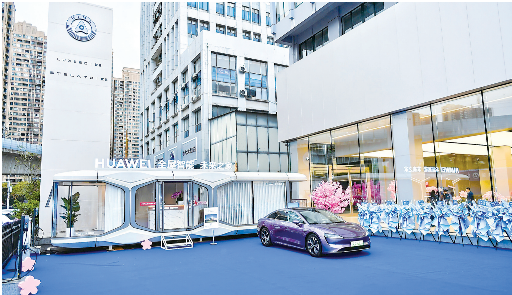
鸿蒙智行授权用户中心·武汉兴业路店。

应对市场风云变幻，中国邮电器材集团有限公司（下称邮电器材）秉承中国通用技术（集团）控股有限责任公司（下称通用技术集团）“以科技进步和品质服务引领美好生活”的使命，确立“成为具有全球竞争力的世界一流信息通信终端生态服务商”的美好愿景。在邮电器材战略指引下，中南公司扎根鄂湘赣，深耕智慧个人、智慧空间、智慧出行、集成服务等领域，构建消费新场景，成为扩内需、促消费、夯实经济“压舱石”的央企主力军。