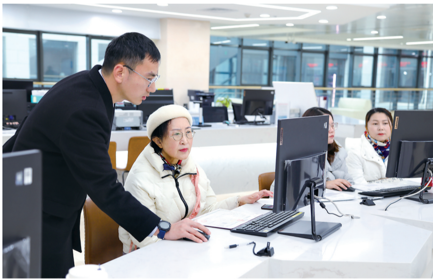
武汉经开区政务大厅,帮办人员(左一)在引导市民办理业务。

“十四五”以来,武汉经开区以“高效办成一件事”为抓手,以数字赋能和制度创新为驱动,推动政务服务从“能办”向“好办、易办、智办”跃升,持续擦亮营商环境“金名片”。