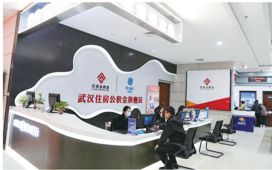
全省首创的“车谷资本岛”专区打造“政银企”合作平台。