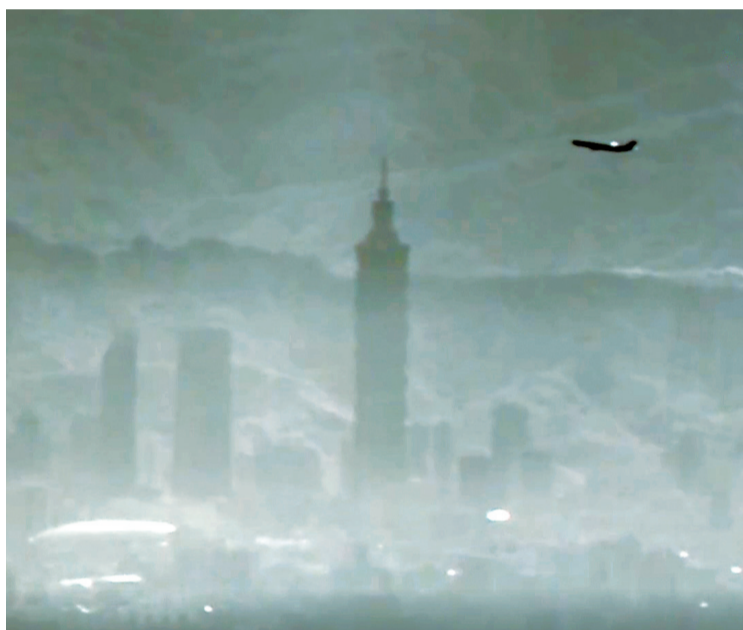
12月29日,央视《新闻联播》播出的演习画面中,解放军无人机俯瞰台北101大厦。