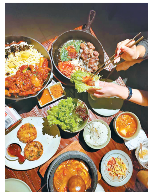
世界好物汇聚武汉,丰富武汉市民的餐桌。