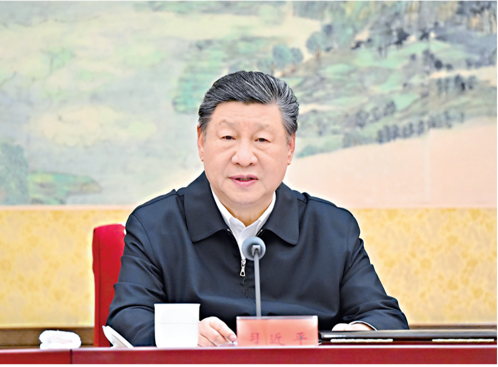
十二月二十五日至二十六日，中共中央政治局召开民主生活会，中共中央总书记习近平主持会议并发表重要讲话。