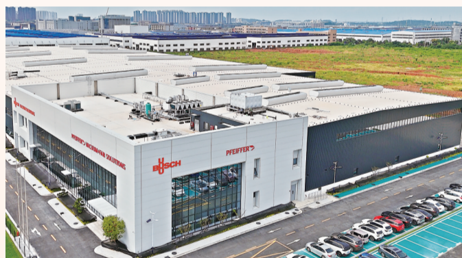
德国普旭集团全球最大海外单笔投资项目武汉基地一期建成投产。