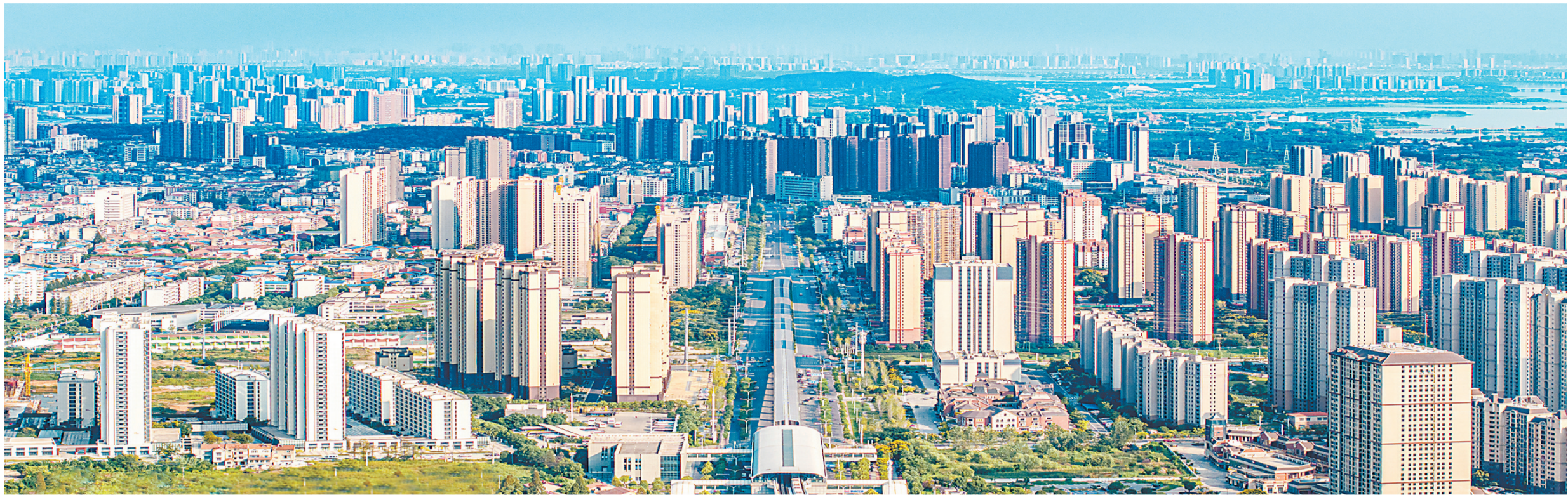
一幅产城融合、宜居宜业的生动画卷正在蔡甸加速绘就。

2026年是“十五五”开局之年，也是固本拓新、竞速搏发的关键之年。蔡甸区将在建功支点的浪潮中，坚持走好开放路、打产业牌、念生态经，持续推进“四大比拼”“十大工程”走深走实，加快打造产业创新高地、国际合作高地、生态示范高地、品质生活高地和城乡融合发展样板区，努力在全省加快建成支点及全市全力打造的“五个中心”、全面建设现代化大武汉中奋勇争先，奋力谱写中国式现代化蔡甸篇章。