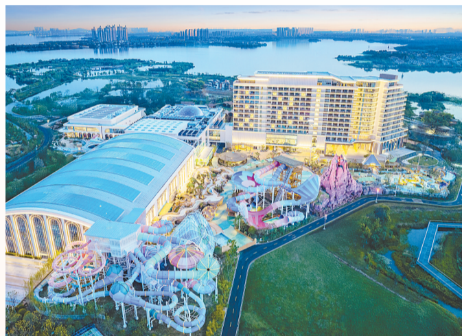
开元森泊度假酒店入选亚洲亲子乐园酒店百强。

坚持强东兴西，加快打造城乡融合发展样板区。建强东部“四城一园”，推动创新新材料、渝商华中总部、国家电力华中应急基地等项目开工建设，铂尔曼酒店、梧桐中心、致富国际酒店等项目建成运营；振兴西部“六街一乡”，新建高标准农田8000亩，加快侏儒山、张湾等农产品加工园建设，培育规模以上龙头企业8家，建强武汉市莲藕产业发展研究院，建成73个和美乡村项目。