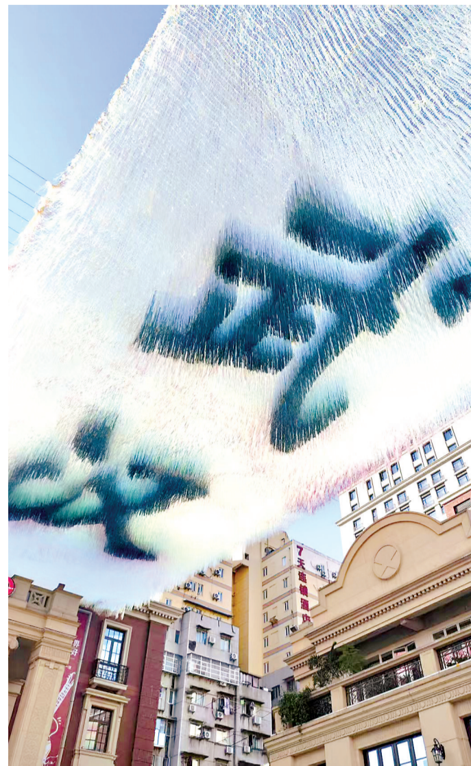
老通城·“通城映像”今年上新的“云镜”天幕装置。