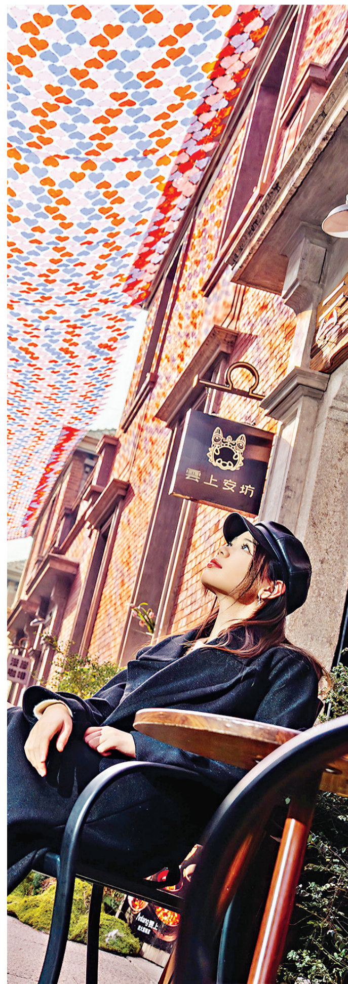
上图：咸安坊上新“心动天幕”装置。