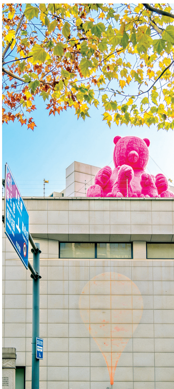
武汉美术馆（汉口馆）屋顶的巨型粉红熊与曾经的网红打卡点“红气球”同框。 武汉美术馆供图